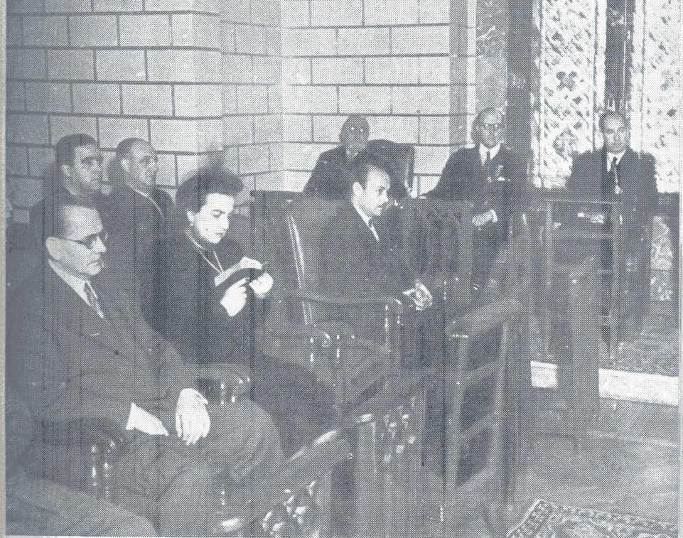
Misa por los caídos.

Madrid. — XLI aniversario de la Ley Fundacional del I. N. P.