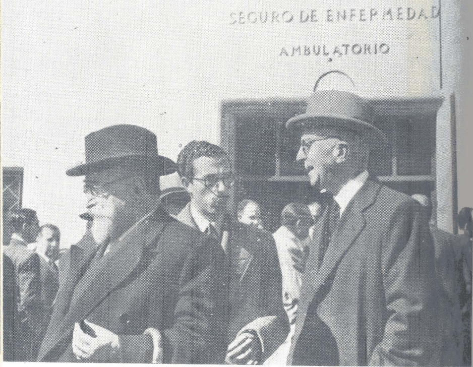
Madrid. — XLI aniversario de la Ley Fundacional del I. N. P. Inauguración del Ambulatorio del Seguro de Enfermedad, en el Paseo de Santa María de la Cabeza