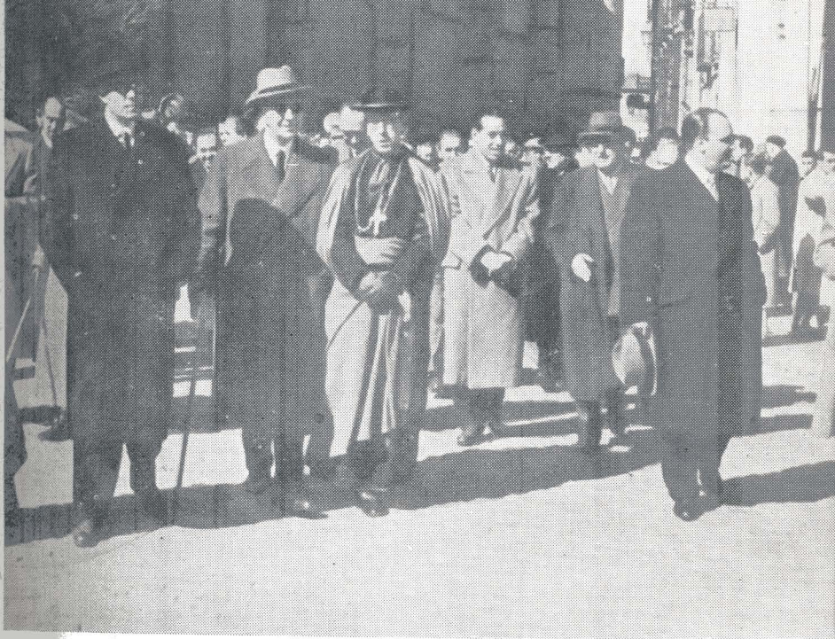
Segovia. — Acto inaugural del edificio para Delegación del I. N. P.