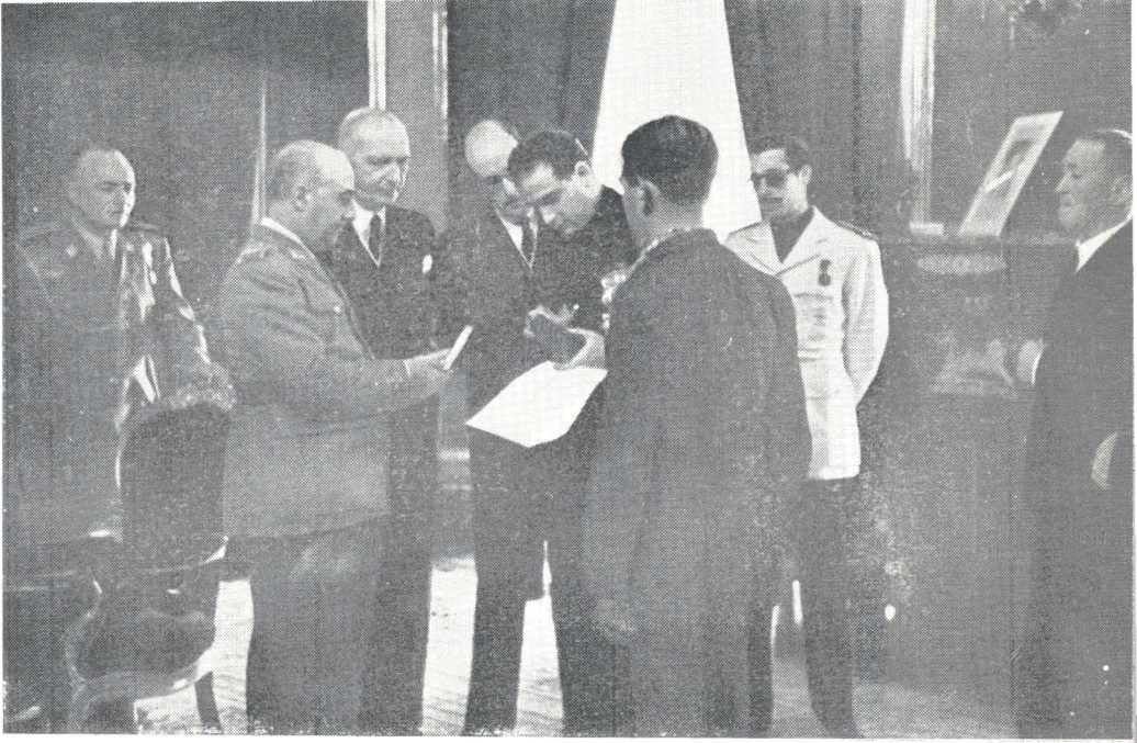
Entrega de Premios a la Natalidad por S. E. el Generalísimo