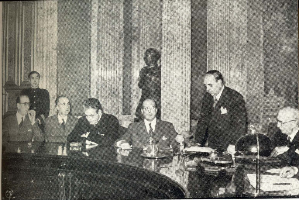
Sesión estatutaria del Consejo.

Madrid, 27 de febrero.—XLIII Aniversario de la Ley fundacional del I. N. P.