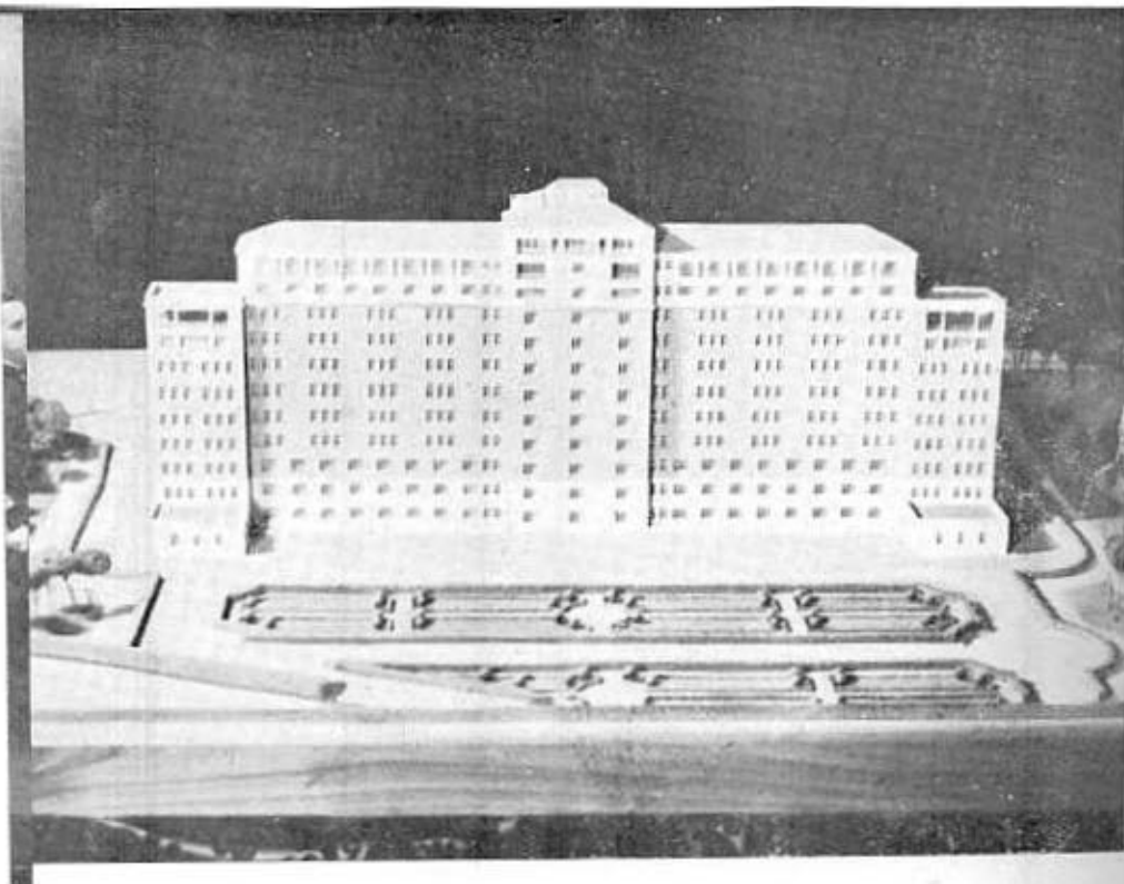
cción de la maqueta,