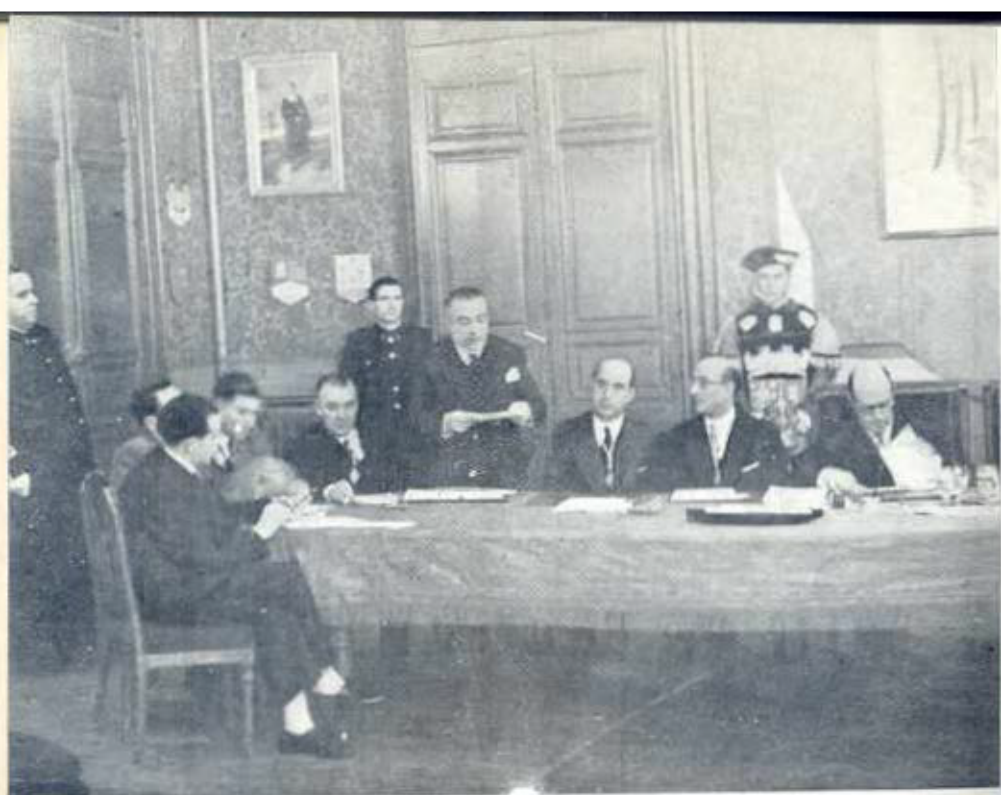
Imposición de Premios Nacionales.