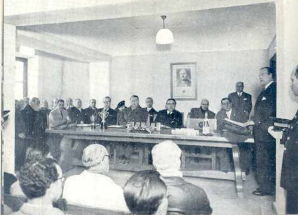
en San Juan Despí.