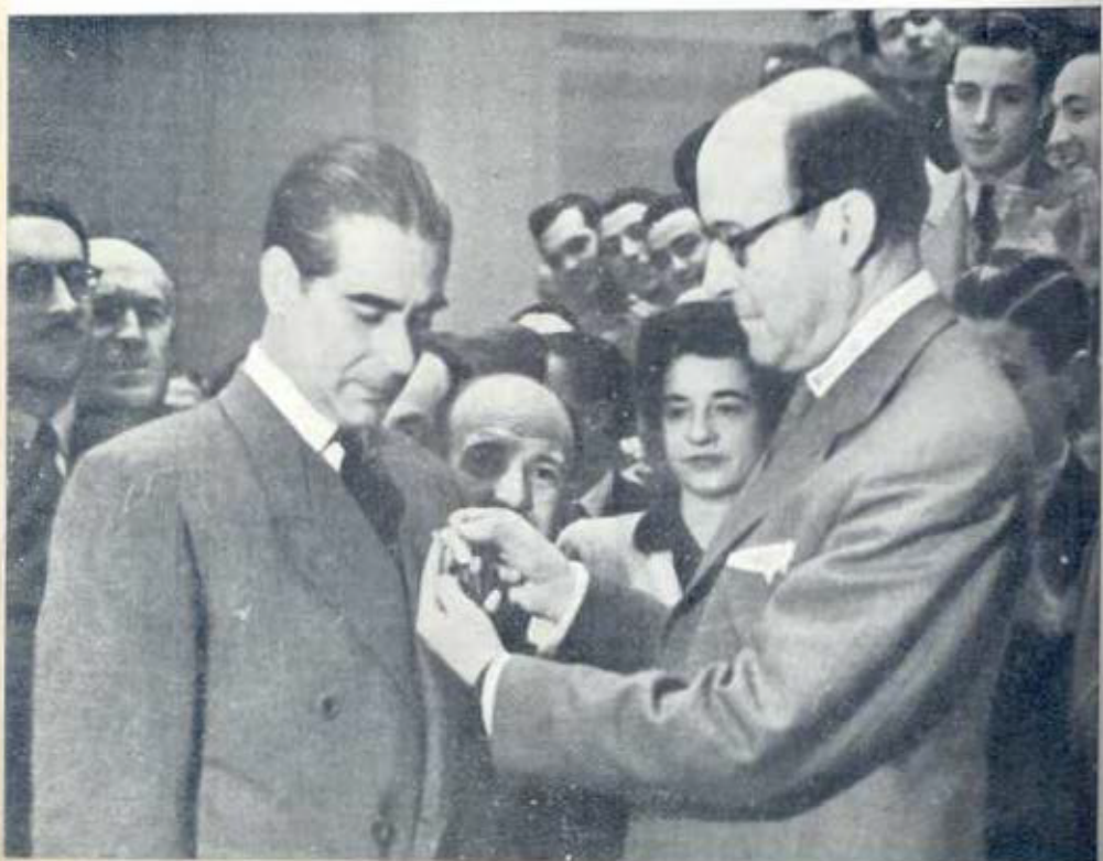
Imposición de Medallas de la Previsión.