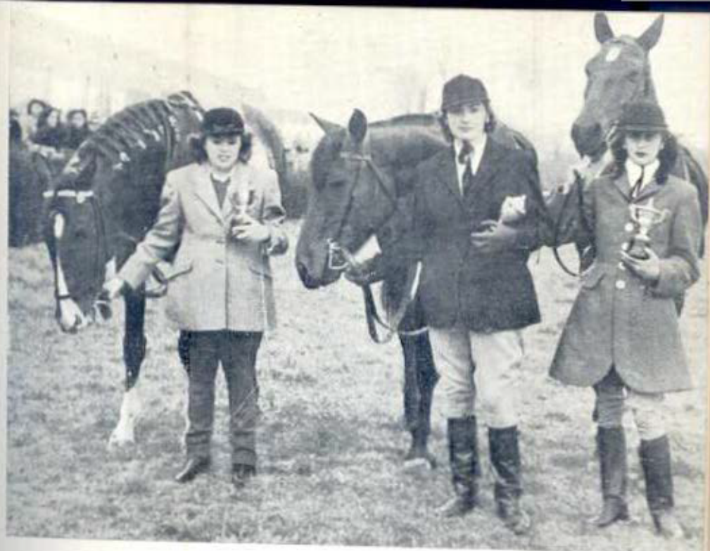
Burgos. — Exhibiciones deportivas de funcionarios del I. N. P.: Entrega de trofeos