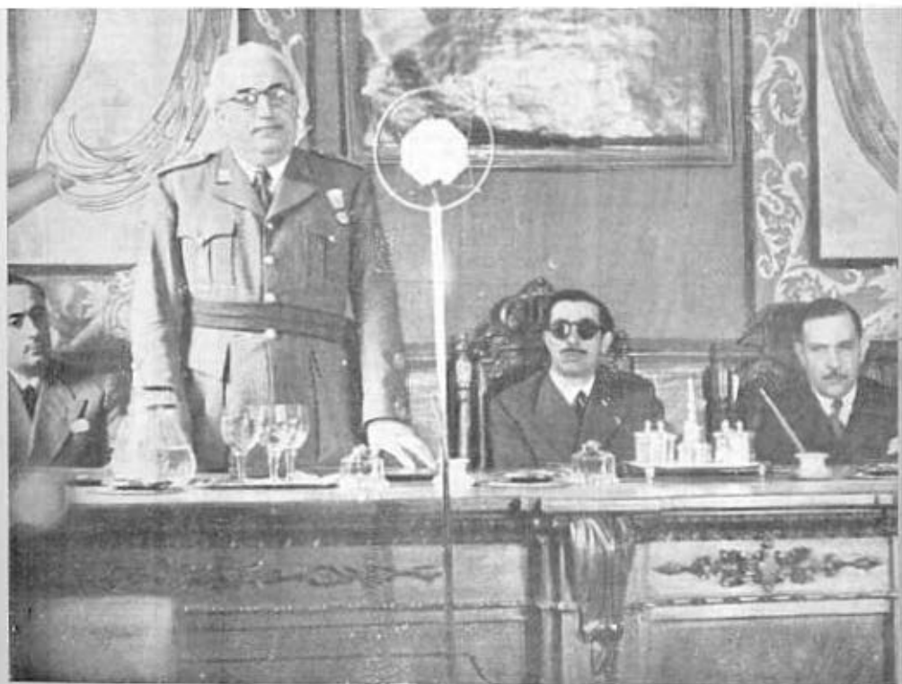
Intervención del Capitán General de la Sexta Región, D. Juan Yagüe Blanco.