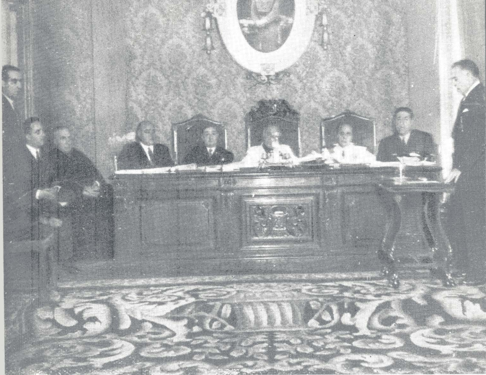
Acto de entrega de 428 pólizas de Dote Infantil, celebrado en la Diputación provincial de Albacete el día 18 de julio último.