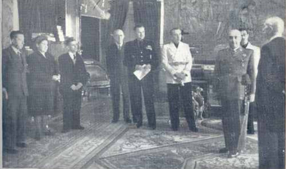
Madrid, 19 de marzo de 1949. — S. E. el Jefe del Estado entrega los Premios Nacionales de Natalidad.