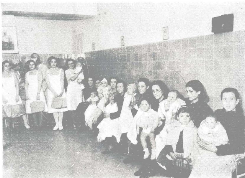
Obra Maternal e Infantil. Interior del Dispensario: Grupo de «madres ejemplares».