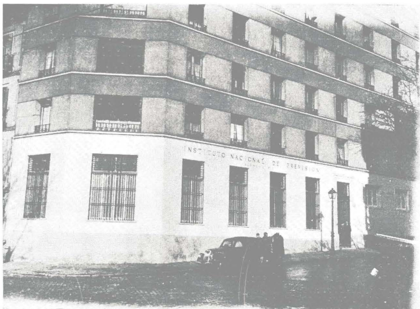
Obra Maternal e Infantil. Edificio en que está instalado el nuevo Dispensario.